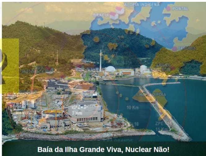
Baía da Ilha Grande Viva, Nuclear Não!

Amanhã, dia 12/04/23, às 9h, a Eletronuclear apresentará as explicações sobre os danos causados no território após a liberação não planejada de substâncias radioativas no mar, ocorrido em setembro de 2022