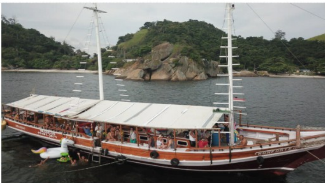
A Escuna Monfort, com capacidade para 120 convidados será a principal embarcação na Barqueata