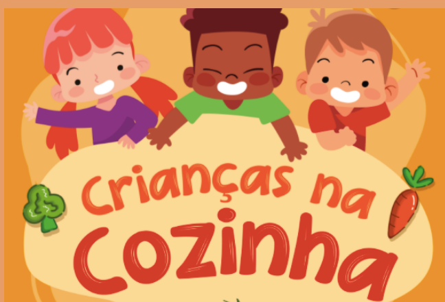
PRINT DA CAPA DO EBOOK, 2021

O livro CRIANÇAS NA COZINHA: Incentivando hábitos saudáveis é uma produção de "muitas mãos". Organizado pelo Núcleo de Estudos de Dietética Aplicada a Diferentes Grupos Populacionais da Universidade Federal do Estado do Rio de Janeiro (UNIRIO).